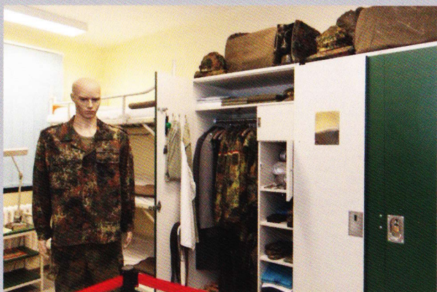
Mannschaftstube der BW

Die Ausstellung beinhaltet die Dokumentation der Bundeswehr am Beispiel des Panzergrenadierbataillons 352 im Kalten Krieg.