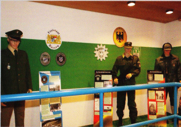
Innerdeutsche Grenze und Grenz-Sicherung