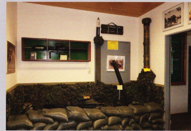
Waffen des Bataillons