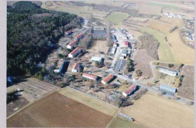
Luftbild (Stand März 2018)