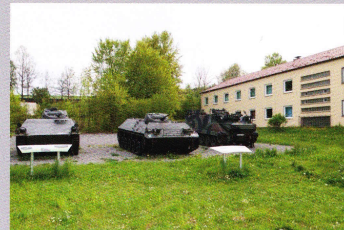
Kettenfahrzeuge des Bataillons